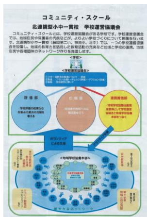
図1 二つ折り学校要覧