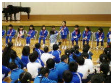
しっかりと発表できた1年生