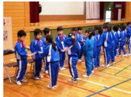
2年生から アサガオの種のプレゼント

1年生は入学してちょうど2週間でしたが、しっかりとした態度で参加することができました。