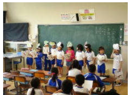
音読劇の発表をしました—2年生

また、今週からは家庭訪問でお世話になります。20分程度の短い時間ですが、お子さんの家庭での様子や、学校への要望などお聞かせいただければと思います。よろしくお願いいたします。