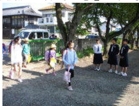
西中生のあいさつに迎えられて 登校しました。

西門と南門に明るく、気持ちのよいあいさつが響き渡りました。小学生も中学生に負けないあいさつができるよう頑張っていきたいと思ひます。