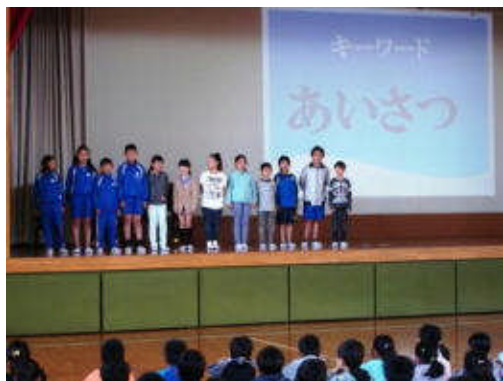
あいさつの大切さを発表してくれました。 放送委員会のみなさん