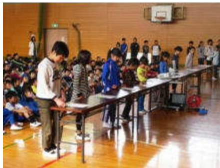
各クラスの代表が署名しました。

「気づき」「考え」「実行する」がJRCの態度目標です。「自ら気づいて、考えて、実行できる。」そんな主体性のある平井っ子になってほしいと願っています。