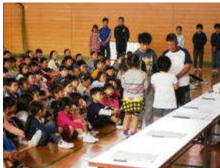
1年生にメンバー章が渡されました。