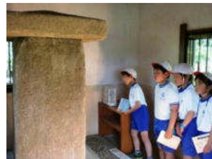
多胡碑に見入る 5年生