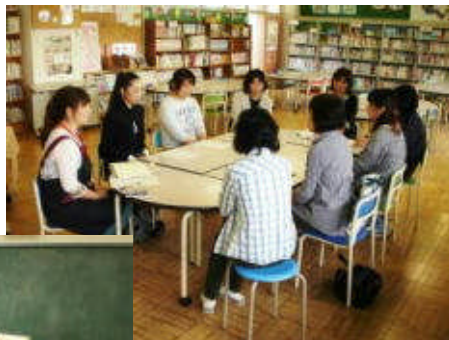
図書ボランティア