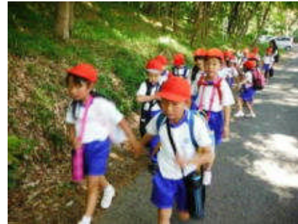
手をつないで元気に歩く 1年生

今年は、児童に買い物を体験させるために、副食を持ってきてもよいことにしました。税込み150円以内と少額でしたが、思い思いのお菓子を買ってきて、楽しそうに食べていました。