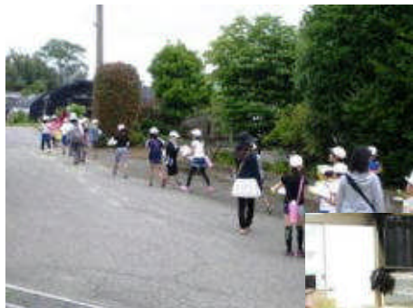
校外学習の引率ボランティア

『無理せずに、できるときに、できることを末永く』お手伝いしていただける方を募集しています。ご協力いただける方がいましたら、ぜひ学校までご連絡ください。