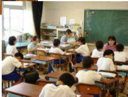
丸つけボランティア