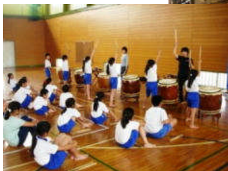
和太鼓クラブの指導