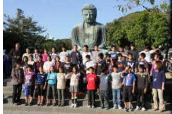
大仏をバックに「ハイ チーズ！」 —高徳院にて—

友達と知恵を出し合い、協力し合って行った班別行動、周到に準備してみんなを楽しませてくれたバスの中でのレク、夕食時の旺盛な食欲など6年生の力を見せてくれました。二日間、本当にお疲れさまでした。