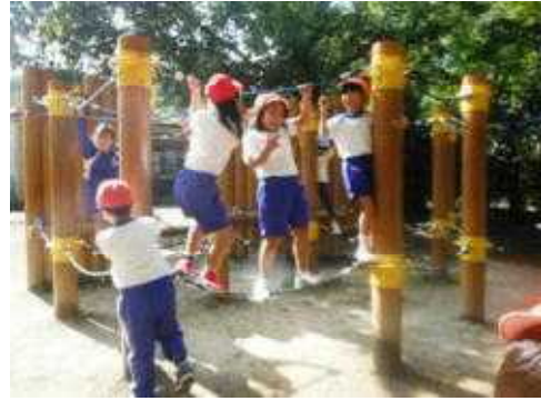
アスレチックも楽しみました！ (こども動物自然公園)