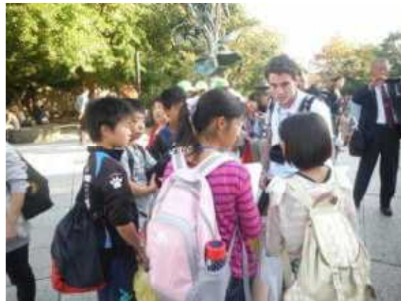
外国の方と英会話に挑戦！ —高徳院にて—