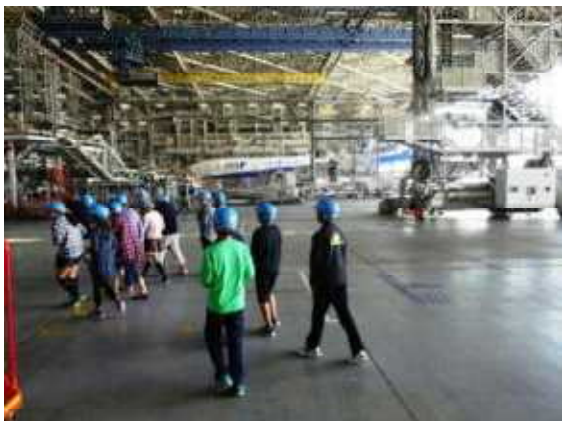
スケールの大きさにびっくり —ANA機体メンテナンスセンター—