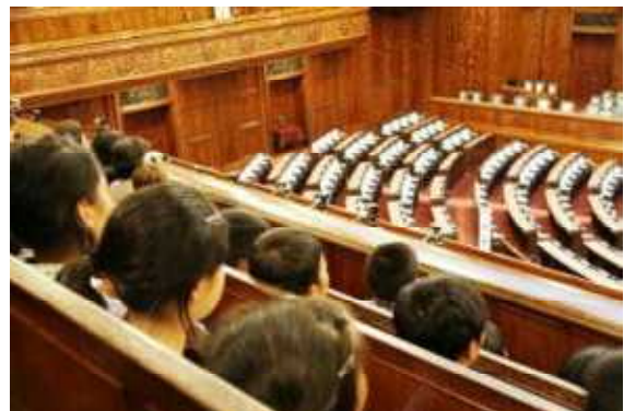
テレビで見る光景が目の前に —衆議院本会議場—