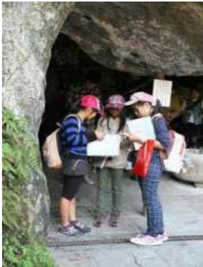
「どの道を行けばいいのかな？」 —銭洗弁財天にて—