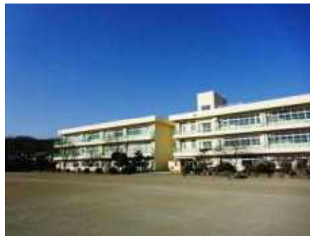
改修工事が終わり、 すっかりきれいになりました！