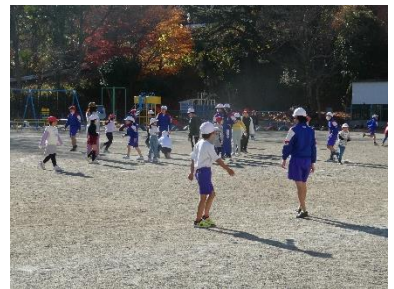
HAPPY はあとふる サンキューツリー