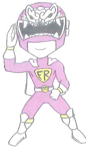
藤岡市 防犯戦隊フジレンジャー