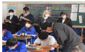
授業を参観する ぽらりす委員 R6.1.23