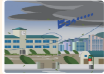
急につめたい風が吹いてきた