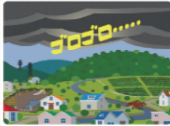
雷の音が聞こえてきた