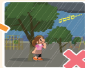
木に落ちた雷で感電することがあります。木のそばからはなれて！