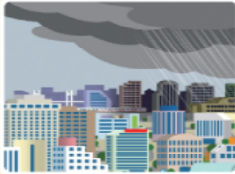
真っ黒い雲が近づいてきた

こんな変化を感じたら、それは積乱雲（入道雲）が近づいてくるしるしです。 まもなく、激しい雨と雷がやって来ます。たつまきがおそってくるかもしれません。