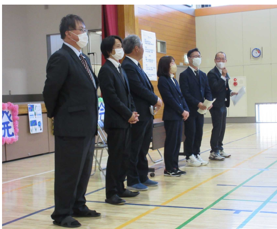
令和6年度PTA本部役員あいさつ

2月21日(金)、PTA年度末総会が行われました。今年度の事業報告・会計報告、来年度のPTA組織等について承認されました。令和6年度PTA本部役員の皆様、各専門委員会役員の皆様、全保護者の皆様には、子どもたちのために、本校の教育活動・PTA活動に、ご理解・ご協力いただき、大変お世話になりました。ありがとうございました。