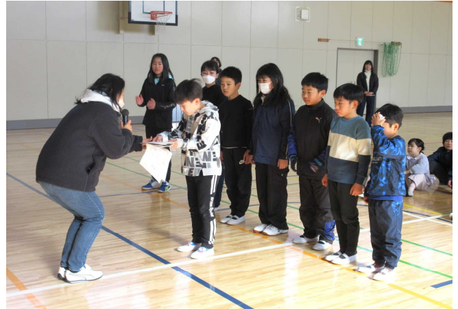
子どもも大人も真剣勝負！【ジャンボかるた大会の様子】優勝チームの表彰！