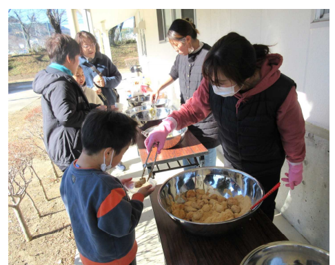
醤油、きなこ、からみもち、ポテトチップス味が登場！