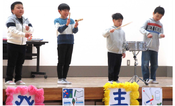
1・2年生「かがやく8人がんばるぞ！」 合奏(1・2年生)、言葉の暗唱(1年生)、かけ算九九暗唱(2年生)