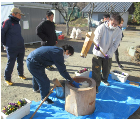
PTA本部の皆様、大活躍！