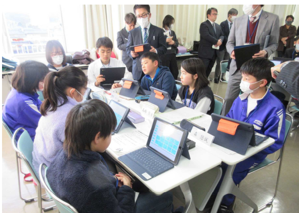
東中学校区グループ協議の様子

市内各小中学校より各2名の代表児童・生徒が集まり、「いじめ問題解決に向けた子ども会議」が行われました。本校からは、5年生の児童会役員が参加しました。はじめに全体協議で、テーマについて話し合い、その後、5つの中学校区に分かれて、「校区でできる取組・どんな意識で行動すればよいか」についてグループ協議を行いました。一人一人の考えをタブレットに書き込み、お互いの意見を発表し合いながら、子どもたちが主体的に考え、話し合っていました。今回の会議で話し合われた取組等については、一貫校の子どもたちで共有し、取組を進めていきます。