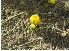
春の訪れを告げる福寿草が咲き始めました