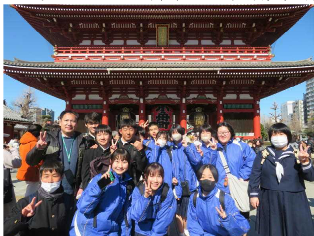
浅草寺 小舟町大提灯前にて

2月14日(金)、2年生が東京校外学習を実施しました。テーマは「Youは何しに東京へ?～最高の仲間と行動し、最高の思い出を作る～」です。この日のために、各班ごとに班別行動の計画を立ててきました。