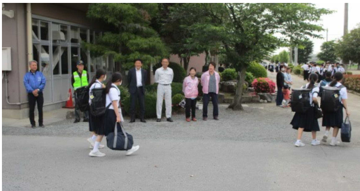
地域でふれあうあいさつ運動

ご家庭でも、人権とは何かについてお子さんと話す機会を設けていただくとともにアクションプランを実践し、子供たちの心の成長に、そしていじめの撲滅につなげていただければ幸いです。