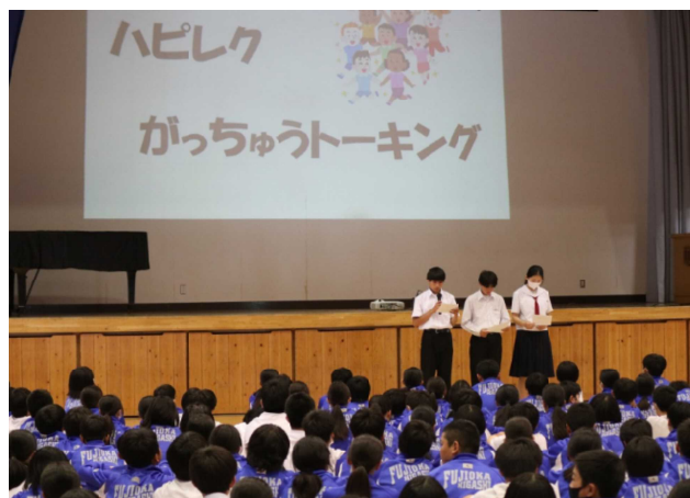
オープニング JRCユネスコ委員会の説明