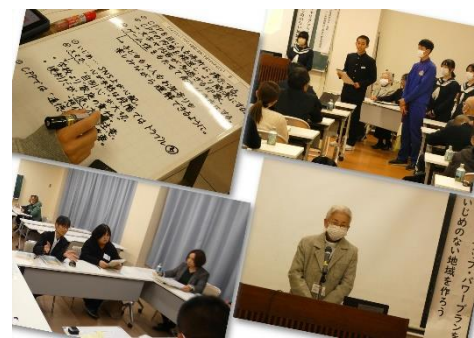
熱心な話し合いが行われる「いじめ問題解決のための教育懇談会」