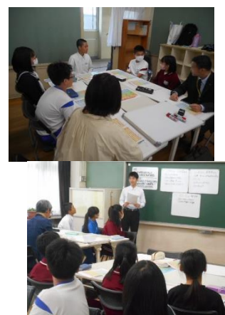
お互いに本音で話し合う「児童会・生徒会役員との熟議」