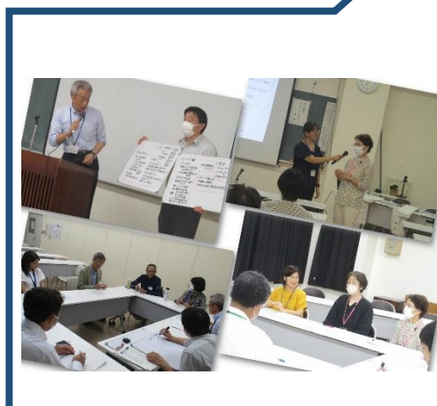
多くのボランティアが集う「とらいアングル総会」

※ 学校運営協議会（ぽ☆ら☆り☆す）委員の任命 4月 第1回 「ぽ☆ら☆り☆す」の組織を作ります。 北一貫校運営方針を確認し 総会」の準備をします。 「とらいアングル（地域学校協働活動）」の準備をします。 5月 第2回 「とらいアングル総会」を開催します。 ○「まちのたからマップ」の紹介 6月 第3回 「いじめ問題解決のための教育懇談会」の内容を検討します。 地域学校協働活動への連携・協働についてPTA本部役員と熟議します。 7月 第4回 「いじめ問題解決のための教育懇談会」の準備をします。 8月 第5回 「いじめ問題解決のための教育懇談会」をPTA本部と共催します。 9月 第6回 目指す姿について、児童会・生徒会の役員と熟議します。 10月 第7回 「いじめ問題解決のための教育懇談会」の準備をします。 11月 「いじめ問題解決のための教育懇談会」をPTA本部と共催します。 12月 「いじめ問題解決のための教育懇談会」をPTA本部と共催します。 1月 学校評価アンケート結果や児童・生徒の実態などから次年度の学校運営について検討します。 2月 次年度の学校運営方針を承認します。 3月 次年度の学校運営方針を承認します。