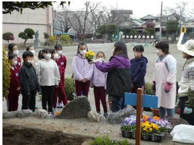
真剣に説明を聞いています