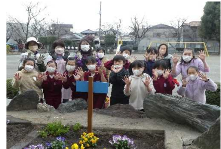
土汚れの手を見せながら 「はい、ポーズ！」

12月に入り、色鮮やかに咲いていたお花から、冬のお花へと植え替えが行われました。いつも来ていただく花壇ボランティアさんに加え、4学年の児童12名も参加しました。この12名の児童は、「お花のお世話が責任持って、継続してできる人」に手を挙げ、1月の寒い中でも、花がら摘みや水やりに欠かさず参加してくれています。