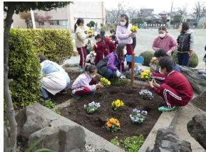
実際に植えてみる