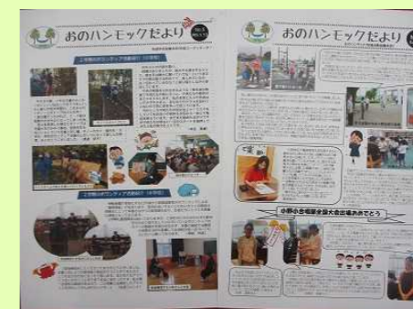
おのハンモックだより