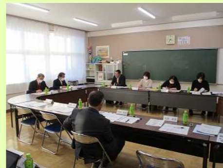
学校協運営協議会の様子