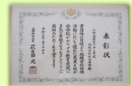
地域学校協働活動に係る表彰 (令和3年2月)