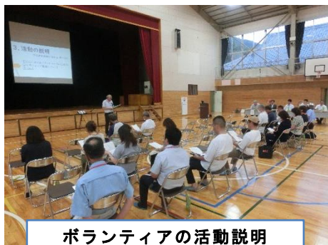
ボランティアの活動説明