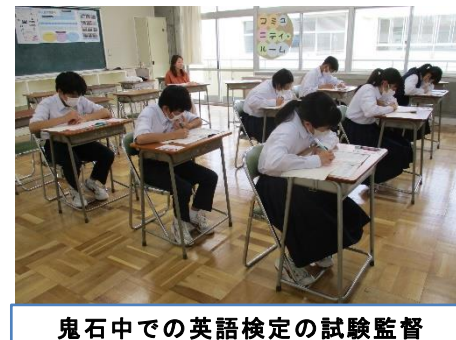
鬼石中での英語検定の試験監督

鬼石連携型小中一貫校では、地域学校協働本部（おにしわくわくネットワーク）によるボランティア活動が年間を通して行われています。今年度も早速活動がスタートし、1学期はこれまでに環境整備作業、読み聞かせ、英検の試験監督、あいさつ運動、登下校や待機児童の見守りなどを実施しました。ボランティアの皆様にお世話になった内容は、このように多種多様です。今後も組織を整備し、学校との協働活動を進めていきたいと思えます。地域学校協働本部（おにしわくわくネットワーク）では、「できる人が できる時に できる事を 笑顔で」を合い言葉にボランティアにご協力いただける方を随時募集しています。実際にボランティア活動をしている様子を見学してからボランティアの登録をすることもできます。「ボランティアに興味を持った」「ボランティアをやりたい」という方は、まず、各小中学校の教頭まで気軽にお問い合わせください。