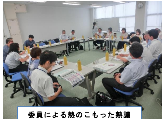
委員による熱のこもった熟議