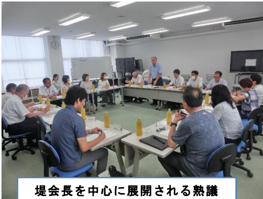
堤会長を中心に展開される熟議

6月26日(水)に鬼石北小学校で、第2回学校運営協議会が開かれました。評価部から「アクションプラン評価について」、地域連携部から「ボランティアのつどいの振り返りについて」、広報部から「コミュニティ・スクール通信について」議題が上がり、委員による熟議が行われました。