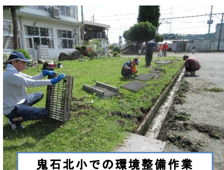
鬼石北小での環境整備作業