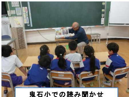
鬼石小での読み聞かせ