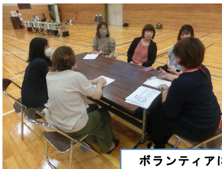
ボランティアについて情報交換