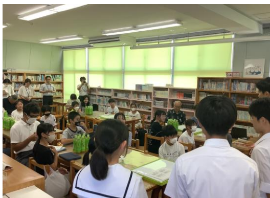
西中サミットの様子