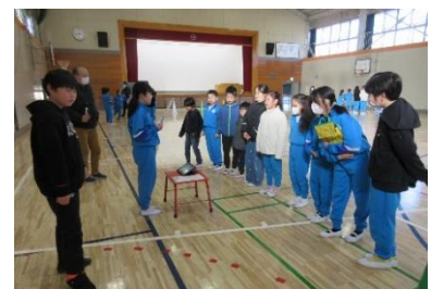
全校オリエンテーリング