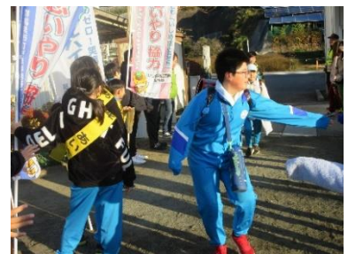
思いやりの宝の木