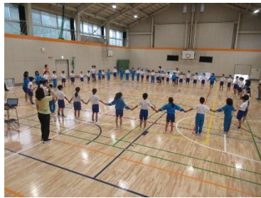
人権旬間オープニング集会