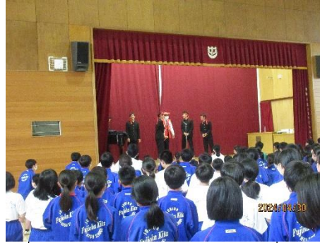
校長先生へのサプライズ