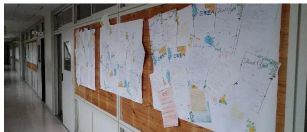
感謝ロード・3年生への感謝の手紙