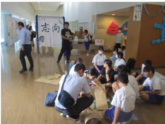
前日の準備の様子