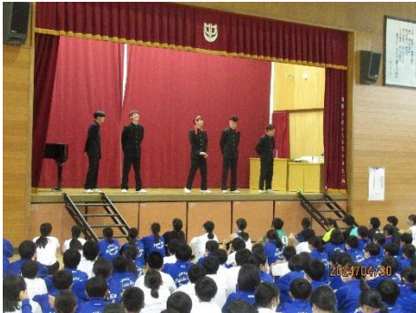
応援団による応援

また、この日は、校長先生の60歳の誕生日でもあることから、サプライズでお祝いをする事で、温かみのある雰囲気を作ることができました。