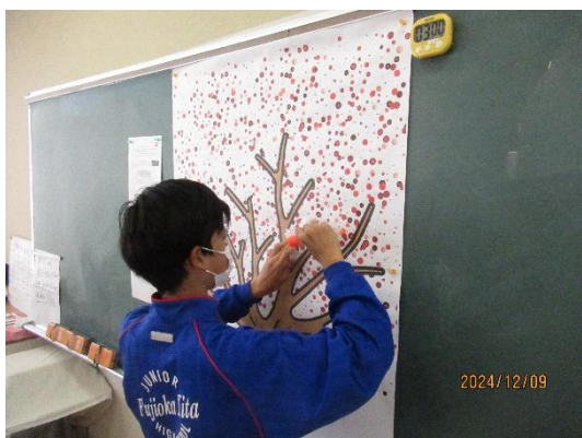
ハートフルツリーを作成する様子

活動を通し、みんなのいいところを再確認するだけでなく、自分たちでいいクラスを作っていこうとする意欲を高めることができました。