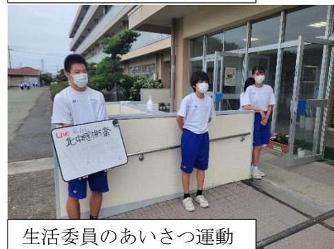
生活委員のあいさつ運動