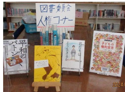
生活委員のあいさつ運動