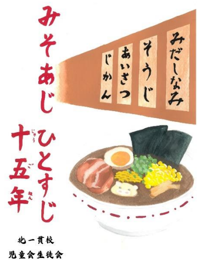
みそあじポスター

また、今年度は、地域にも「みそあじ」を広げられるよう、ポスターの製作を行い、地域の掲示板に掲示をしていただきました。