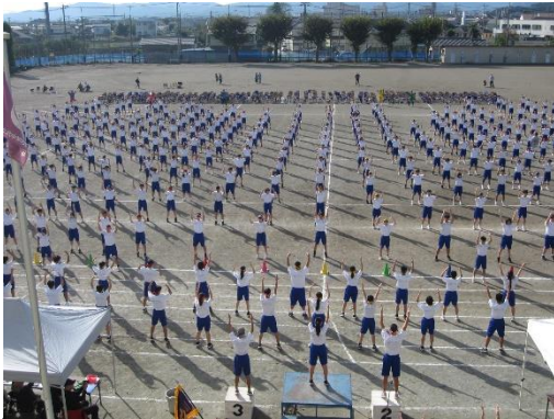
北中学校の全体美