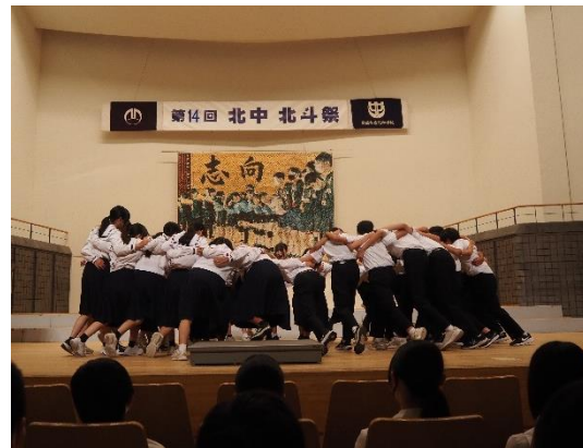
合唱前にクラスが団結する様子