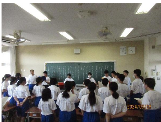
学級での練習の様子

当日を迎えるまで、各クラスは練習を工夫し、クラスとしての団結力・絆を深めました。学校行事を通して友達の良さやクラスのあたたかさを感じるにより、いじめが起きない環境を作ります。北斗祭では、各クラスが一丸となり合唱コンクールの金賞を目指しました。クラスで協力し、素晴らしい合唱を作り上げました。