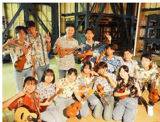
ウクレレを演奏するグループ