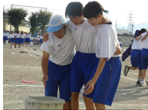
委員会対抗 SDG s リレーの様子