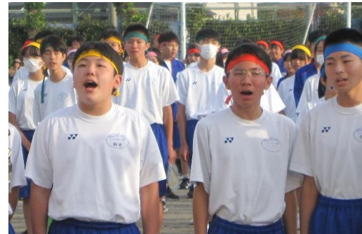
全校で「栄光の架け橋」を歌う様子