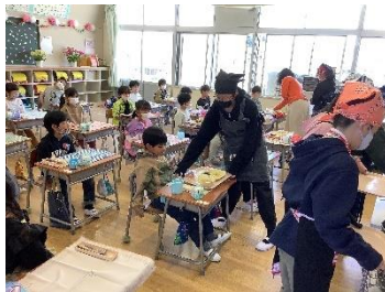
1年生の給食準備を手伝う6年生

他学年や他校の仲間と交流をしながら、つながりを深めました。また、相手の立場や気持ちに合わせた接し方や言葉遣いなどを考えるきっかけにもなりました。