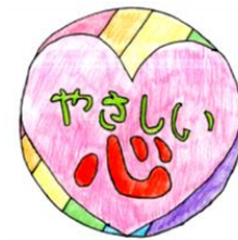
共通のシンボルマーク