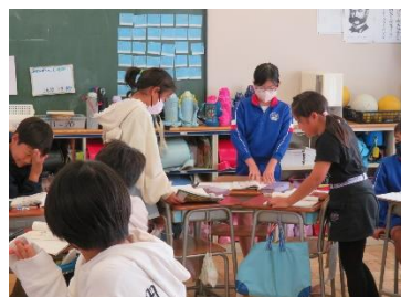
総合や国語での協働活動