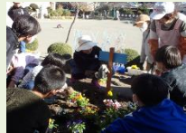
花壇ボランティア