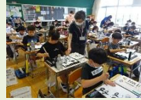
習字ボランティア