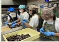
チャレンジウィーク