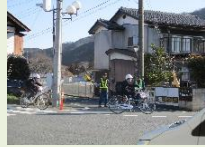
登下校見まもり活動