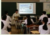
社会人話を聞く会