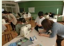
ミッションボランティア