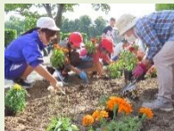
花壇ボランティア