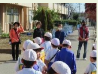
まち探検見まもり活動