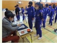
習字ボランティア