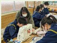
ミンボランティア