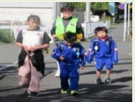
登下校見まもり活動