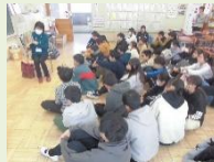
読み聞かせボランティア