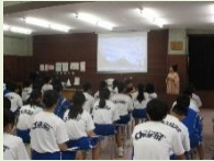
社会人に話を聞く会