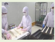
チャレンジウィーク