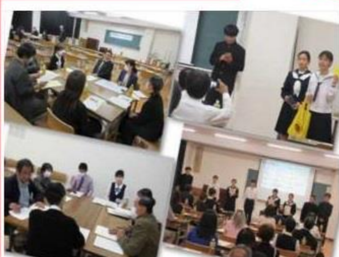
熱心な話し合いが行われる「いじめ問題解決のための教育懇談会」