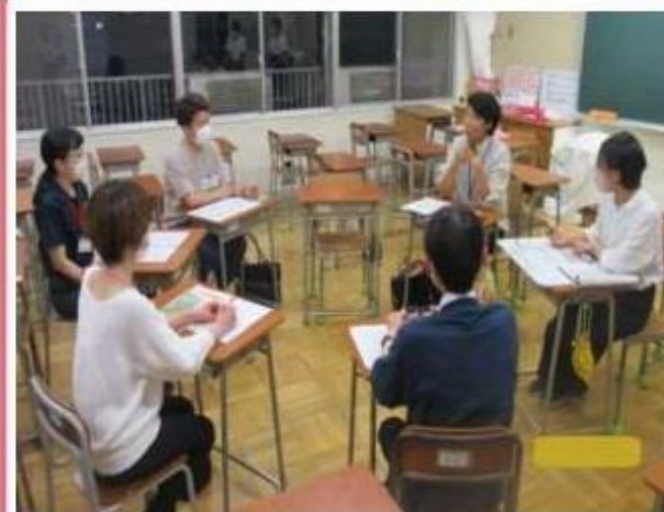
多くのボランティアさんが集う「とらいアングル総会」