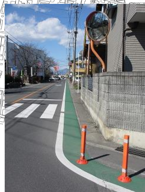
グリーンベルトを作り、ポストコーン 2 本設置。