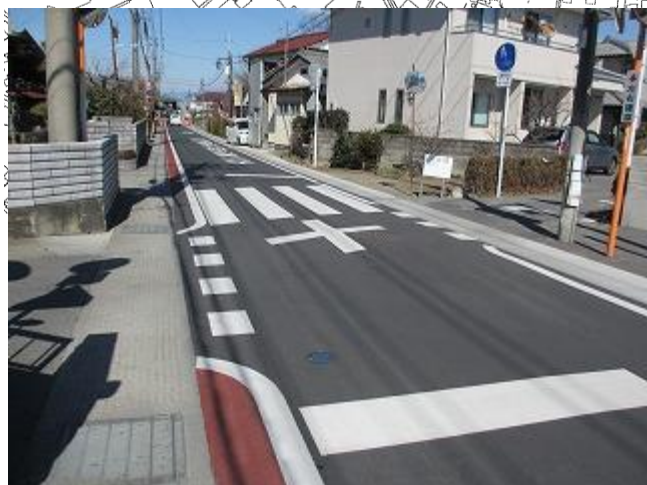
「横断歩道」、「交差点注意」、「停止線」を引き直し、ドライバーに注意喚起しています。