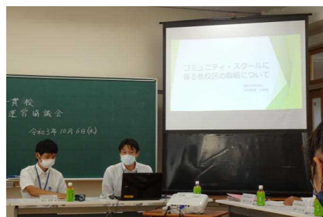
指導主事による講話の様子