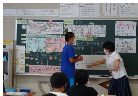
ネームプレートの活用と計画的な板書