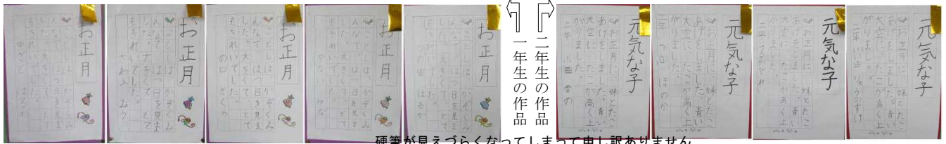
硬筆が見えづらくなってしまっって申し訳ありません