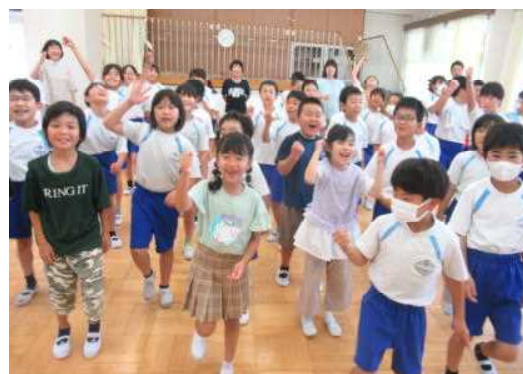
全校音楽集会ではじける笑顔！