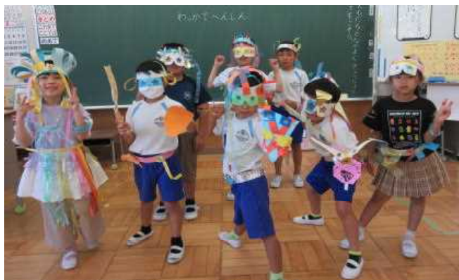
1・2年生「わっかでへんしん」

1学期（授業日：71日）、美九里西小学校の子どもたちは、みんな本当によく頑張りました。そして、それぞれの学年で頼もしいほどに成長しています。終業式では、子どもたちに「1学期の自分の頑張りを自分でほめてください。そして夏休みには、家庭や地域で、学びいっぱい（夏休みの宿題、夏休みならではの体験）、笑顔いっぱい（あいさつ、家族の手伝い）、やる気いっぱい（事故なく健康な生活）に過ごしてほしい」と伝えました。保護者・地域の皆様には、1学期間大変お世話になりました。夏休みも引き続き、家庭や地域での子どもたちの見守りをよろしくお願いいたします。