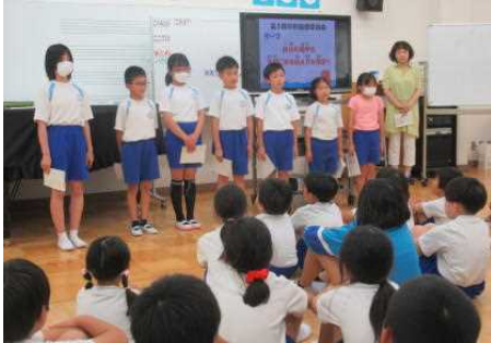
児童保健委員会の進行・発表

全校児童が参加して「第1回学校保健委員会」を行いました。学校薬剤師の先生、PTA本部・広報厚生委員会・環境研修委員会の皆様にご出席いただきました。児童保健委員会の子どもたちの進行で、縦割り班に分かれて、「自分も相手も大切に伝える方」について、場面を想定して具体的に考えロールプレイを行いました。今回みんなで学んだことを、これからの生活の中で意識して取り組んでほしいと思います。