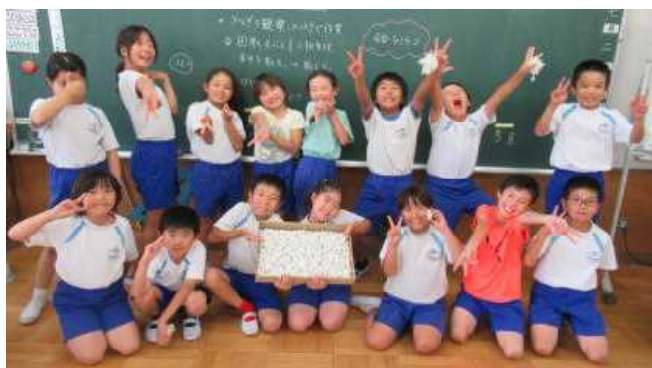
4年生「高山社学」まゆ415個！