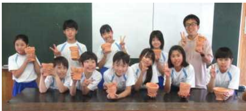
6年生「縄文土器づくり」