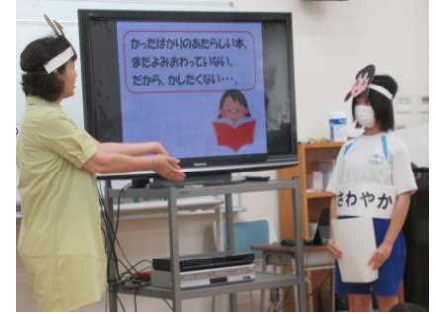
班で考えたことを発表しました (ロールプレイ)