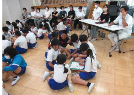
縦割り班で考えました