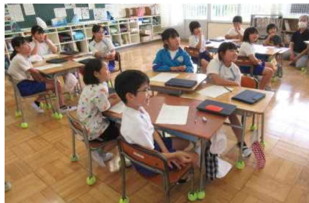
3年生「情報モラル学習」