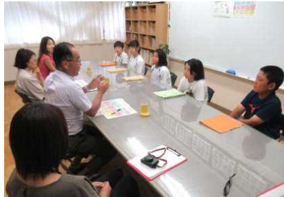
委員さんからアドバイスやエールをいただきました。

学校たちも情報交換会を行いました。3名の子どもの発表も大変楽しかったです。委員さんたちとの交流も大変楽しかったです。委員さんたちとの交流も大変楽しかったです。委員さんたちとの交流も大変楽しかったです。