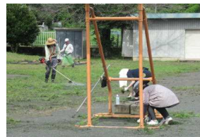
校庭南側の除草作業