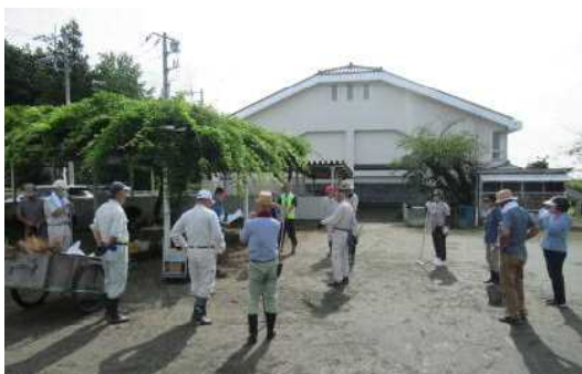
12名の地域の皆様にご協力いただきました

地域の皆様、地域づくりセンター美九里の職員の皆様にお世話になり、校庭南側の除草作業を中心に環境整備をしていただきました。おかげさまでとてもきれいになりました。子どもたちのためにありがとうございました。