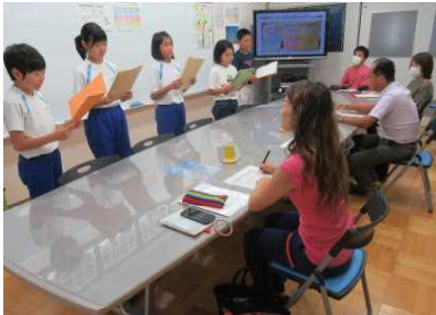
児童会役員より「子どもの取組」について発表しました。