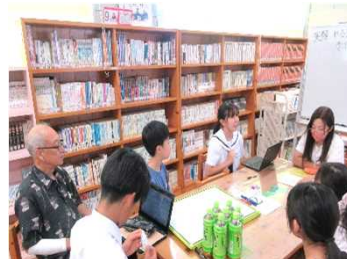
それぞれの学校の実践を情報交換しています。