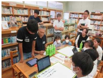
委員も各班に入り議論に加わりました。

その結果、西一貫校では「全校児童生徒がお互いに尊重し認め合う意識を高める」取組として、「あいさつ運動の継続・充実」「よいところ探し」「振り返り活動」を共通実践することになりました。子どもたちの真剣な議論の様子をうかがい、身の引き締まる思いがしました。