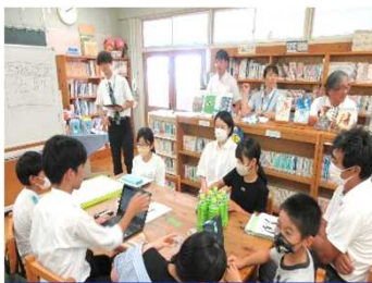
西中生の進行が素晴らしかったです。