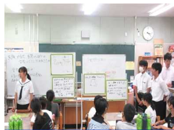
各班が意見を出し実行内容を決めました。