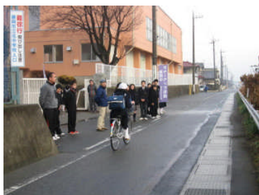
中高あいさつ運動の様子

1月は厳しい寒さが続きました。空気も乾燥し、インフルエンザが本校にも流行しました。年末に2,3年生、年が明けて1年生に広がり、学級閉鎖等の対応を取りました。2年生は、22日に東京校外学習に無事に出かけられました。雪も何度か降りました。2月に入り4日が立春、徐々に日も延びてきています。春が待ち遠しい今日この頃です。