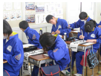
校内書き初め大会の様子

三学期の始業日1月7日(水)に校内書き初め大会を実施し、生徒が真剣に書き初めに取り組みました。新年での自分の新たな気持ちを文字に込め、全員の生徒が真剣に自分の書き初めを行いました。代表者の作品が美術作品や理科・社会の研究作品と一緒に1月24日(土)・25日(日)に市民ホールで開催された「市図工美術・書き初め展・理科社会研究作品展」に出品されました。市の作品展では、今年も約3000人の来場者がありました。