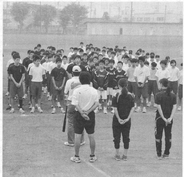
↑走る前に先生の話聞く子どもたち。厳しい言葉もありますが、子どもたちは真剣に耳を傾けます。

「この活動を通して何に対しても一生懸命かつ主体的に行動できる生徒が増えてきた」と先生たちは